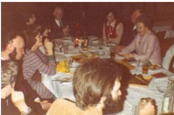
Frá fyrsta þorrablóti dýralækna í landnámi Ingólfs 1980.

voru samskipti milli þeirra ekki eins auðveld og í dag. Aðalfundir félagsins voru því það tækifæri þegar dýralæknar og makar gátu borið saman bækur sínar og sýnt sig og séð aðra ef svo má að orði komast. Að loknum fundarstörfum var alltaf haldin mikil kvöldverðarveisla þar sem gleði ríkti og mátti líkja þessum samkomum við sannar fjölskyldusamkomur. Nú þegar samskiptatæknin gerir allt samband milli dýralækna auðveldara samfara mikilli fjölgun dýralækna og dýralæknapraksísinn ekki lengur rekinn sem fjölskyldufyrirtæki virðist sem þessir „fjölskylduaðalfundarkvöldverðir“ hafi misst sinn tilgang. En áfram skemmta dýralæknar sér.