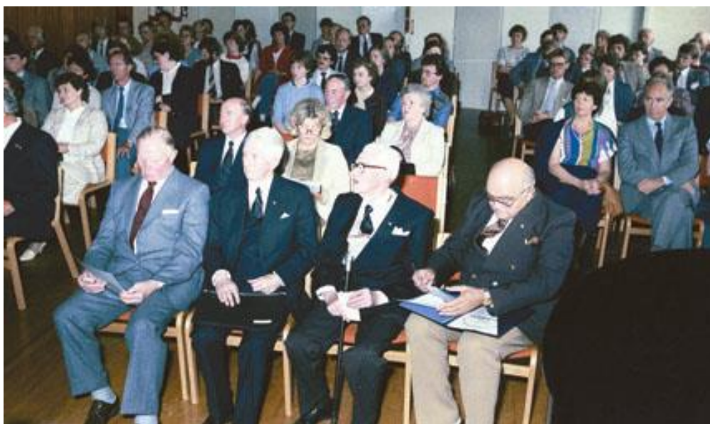
Aðalfundur DÍ á Bifröst 1984. 50 ára afmæli félagsins