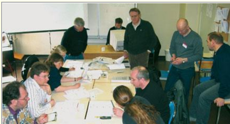
Námskeið í viðbragðsáætlunum gegn smitsjúkdómum.

Þetta hefur síðan verið fastur liður á flestum aðalfundum félagsins og einnig haust- og vorfundum eftir því sem ástæða hefur þótt til.