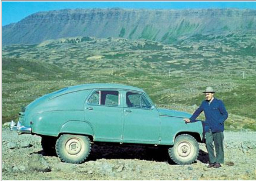
Háleggur, praksís-bíll Guðbrandar E. Hlíðar. Rússneskur jeppi með fólksbíla yfirbyggingu, 1958.