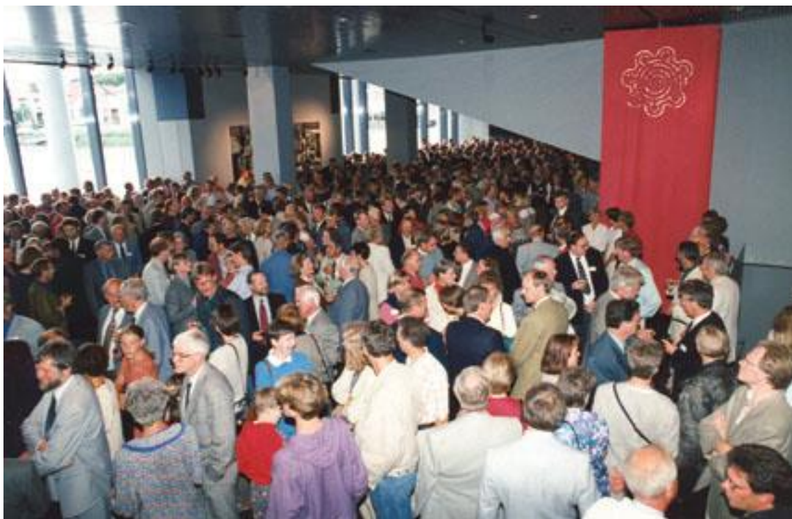
Frá móttöku við upphaf XVII. Norræna dýralæknaþingsins 1994 í Ráðhúsi Reykjavíkur