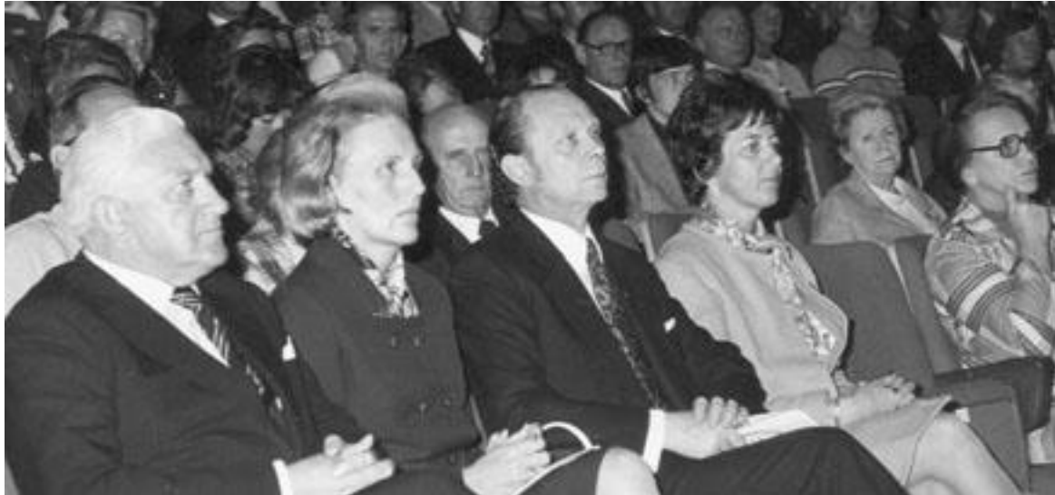
Frá Opnun XII. Norræna dýralæknaþingsins í Háskólabíói 1974.