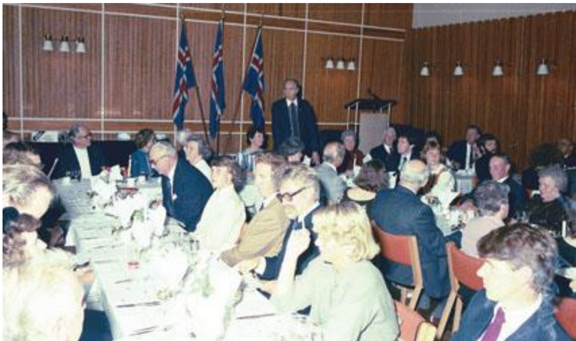
Afmælishóf DÍ að Bifröst 1984